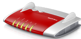
FRITZ!Box 4020 + FRITZ!Box 4040